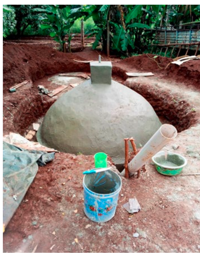
Viele unserer Partner unterstützen die Menschen ihrer Region beim Bau von Biogasanlagen.