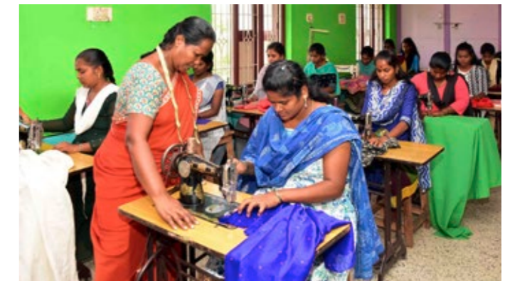
In den von WARM unterstützten Gruppen lernen Frauen für ihre Selbstständigkeit zum Beispiel das Schneidern.