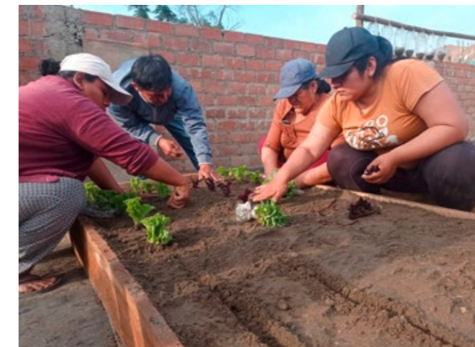
Die Frauen packen mit an, hier beim Anlegen neuer Beete für ihre Küche.