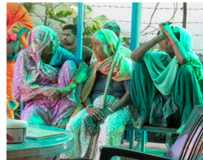
Patientinnen warten auf ihre Behandlung durch Fachpersonal von RESIC.

Die Klinik von RESIC ist sechs Tage in der Woche geöffnet. Jeden Samstag behandeln gut ausgebildete Ärzt*innen, an allen anderen Tagen sind Krankenschwestern vor Ort. Dreimal im Jahr erreicht RESIC mit Gesundheitscamps in ländlichen Gebieten zudem Menschen, für die der Zugang zu einer guten Gesundheitsversorgung noch schwieriger ist.