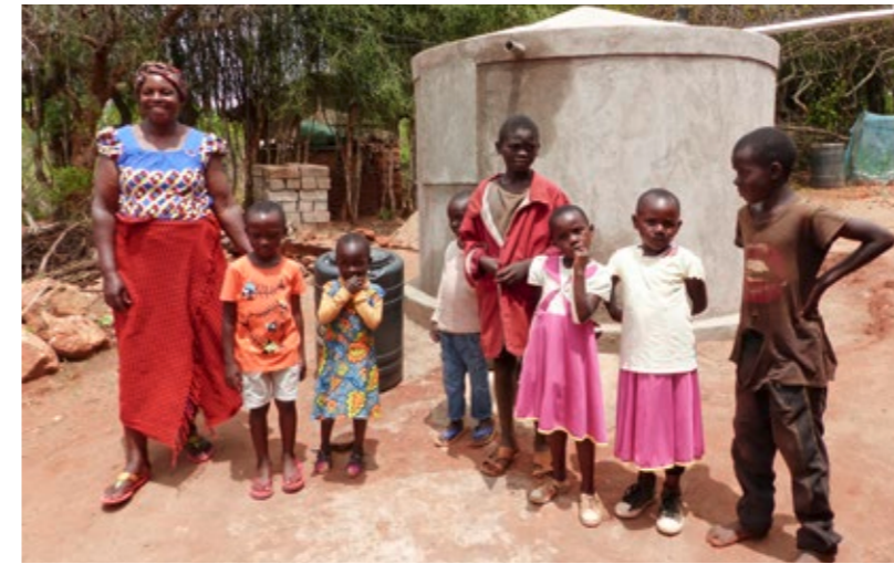
Auch Wassermanagement, hier ein Wassertank, gehört zu den Themen, bei denen SACDEP rund 12.000 Farmer*innen pro Jahr unterstützt.