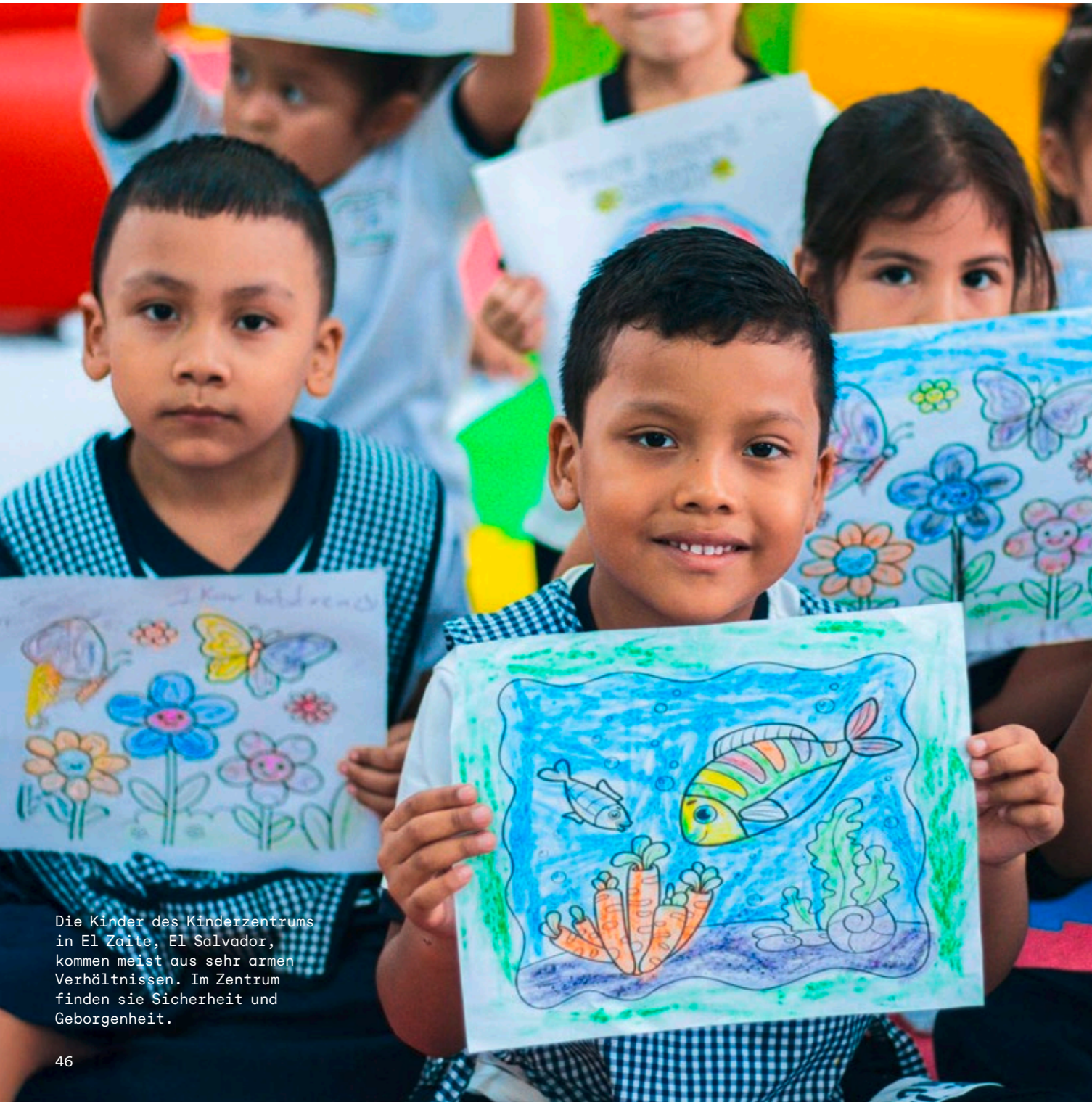
Die Kinder des Kinderzentrums in El Zaito, El Salvador, kommen meist aus sehr armen Verhältnissen. Im Zentrum finden sie Sicherheit und Geborgenheit.