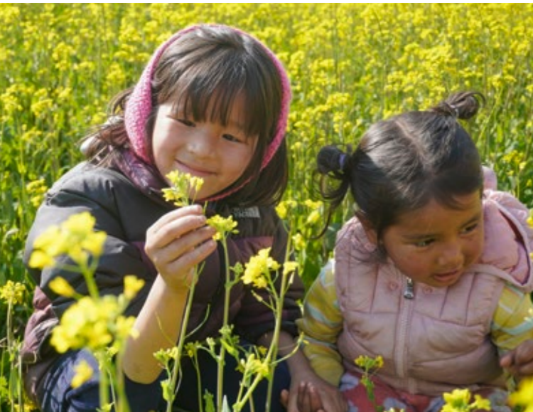
Kinder des WFN-Frauenhauses: So wie ihre Mütter finden sie hier Bildung und Unterkunft, vor allem aber Sicherheit und Lebensfreude.

Die Women's Foundation Nepal und das Patenschaftsprogramm der GLS Zukunftsstiftung Entwicklung geben Kindern in Not Geborgenheit und Zugang zu Bildung