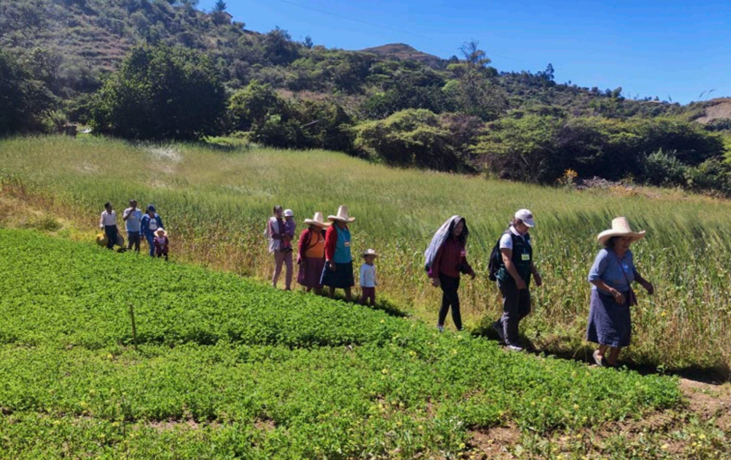
Wie stark Wissen die ländliche Bevölkerung der Hochanden für den Erhalt ihrer Umwelt macht, erlebt ACICA regelmäßig. Schulungen im organischen Landbau sind deshalb zentral.

Peru: Überleben und Lebensgrundlagen schützen in den Hochanden