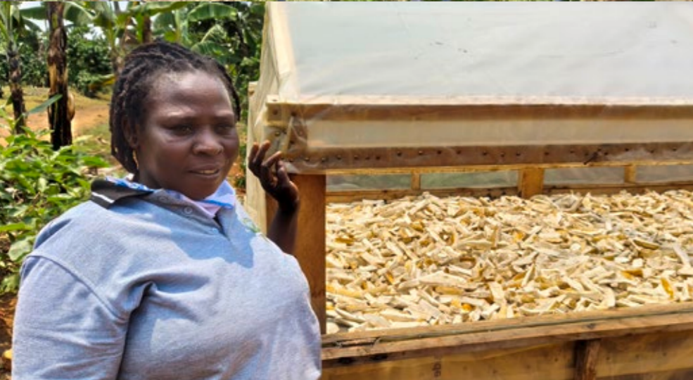
Links oben und Mitte: solarbetriebene Pumpe und Solartrockner nutzen die Kraft der Sonne; rechts oben und unten: Biogasanlagen versorgen mehr als 90 Haushalte in den Regionen unserer Partner mit Gas für Kochen und Beleuchtung.